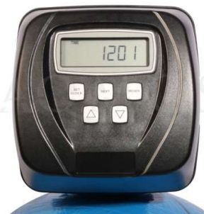
Abb. 2: Steuerventil Clack WS 1 CI

GFK-Druckflasche, gefüllt mit hochwertigem Ionenaustauscherharz, PE-Solebehälter für einen Salzvorrat von max. 180 kg, mengengesteuertes Zentralsteuerventil Typ Clack WS 1 CI, integriertes Feinverschneidungsventil, Absaugeinrichtung und Verbindungsleitung zum Zentralsteuerventil.