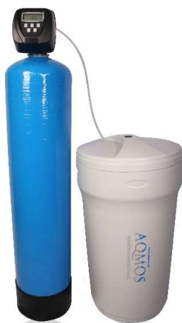
Abb. 1: Aqmos CMX-312