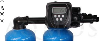
Abb. 2: 1x Steuerventil Clack WS 1 mit Verrohrung

2x GFK-Druckflasche, gefüllt mit hochwertigem Ionenaustauscherharz, PE-Solebehälter für einen Salzvorrat von max. 180kg, mengengesteuertes Zentralsteuerventil Typ Clack WS 1 mit Verrohrung (ein Steuerkopf), integriertes Feinverschneidungsventil, Absaugeinrichtung und Verbindungsleitung zum Zentralsteuerventil.