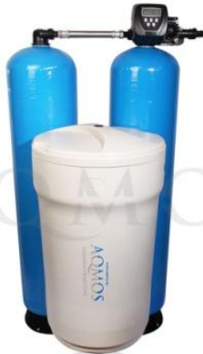
Abb. 1: Aqmos CMD1-400