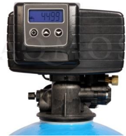
Abb. 2: Steuerkopf Fleck 5600 SXT

GFK- Druckflasche, gefüllt mit hochwertigem Ionenaustauscherharz, PE- Solebehälter für einen Salzvorrat von max. 120kg, mengengesteuertes Zentralsteuerventil Typ FLECK 5600, integriertes Feinverschneidungsventil, Absaugeinrichtung und Verbindungsleitung zum Zentralsteuerventil.