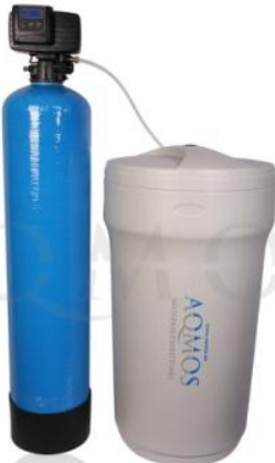
Abb. 1: Aqmos FMX-160