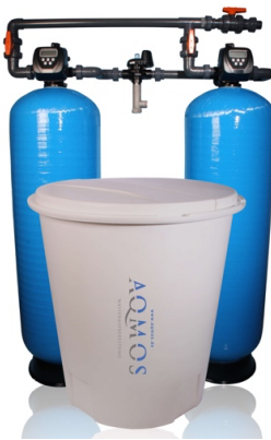
Abb. 1: Aqmos CMDI2-2400